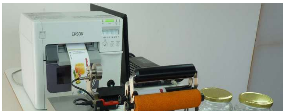
Pk-52 connesso a EPSON TM-C3500 stampa e applica etichette a colori con inchiostri resistenti a polimeri. Tutto in un solo passaggio, anche fronte/retro in piena autonomia.